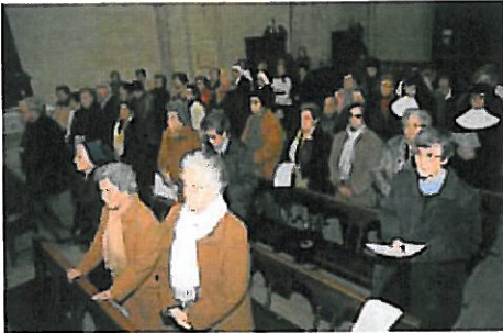
Miembros de la Familia Vicenciana durante la celebración.