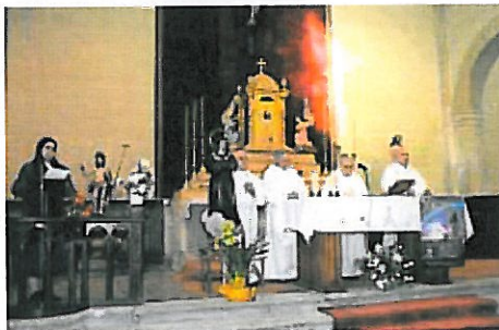
Eucarística en la iglesia de la Venerable Orden Tercera.